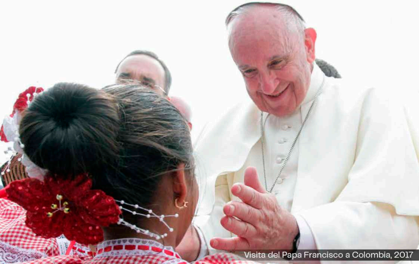
Visita del Papa Francisco a Colombia, 2017

el afán de superación, la lealtad y el compromiso con el pueblo hasta las últimas consecuencias" no está lejos del mensaje franciscano contra la corrupción y la desigualdad, y en defensa de la dignidad humana.