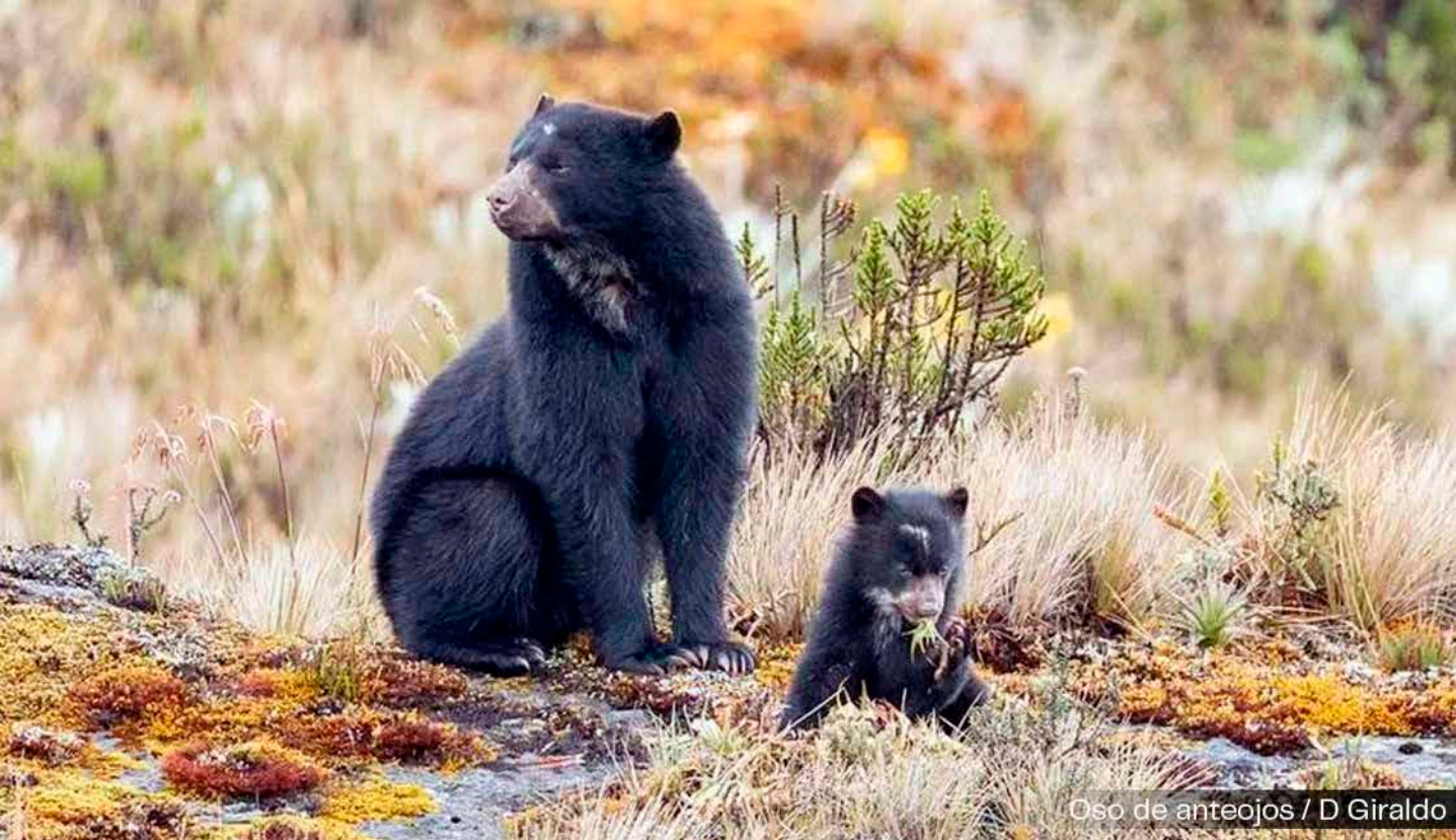
Oso de anteojos

En nuestro país, en 2018 el Consejo de Estado amparado en el Principio Constitucional de Precaución y sobre la base científica del impacto negativo que trae el Fracking sobre el ambiente y la salud, decretó Medidas Cautelares y suspendió cualquier actividad de explotación o exploración de hidrocarburos bajo el método de Fracking [3]; sin embargo, quedó una pequeña ventana de oportunidad para las multinacionales de los hidrocarburos, ya que este Consejo permitió la realización de los PPII (Proyectos Piloto de Investigación Integral) para “evaluar la viabilidad de la aplicación” del Fracking en nuestro país.