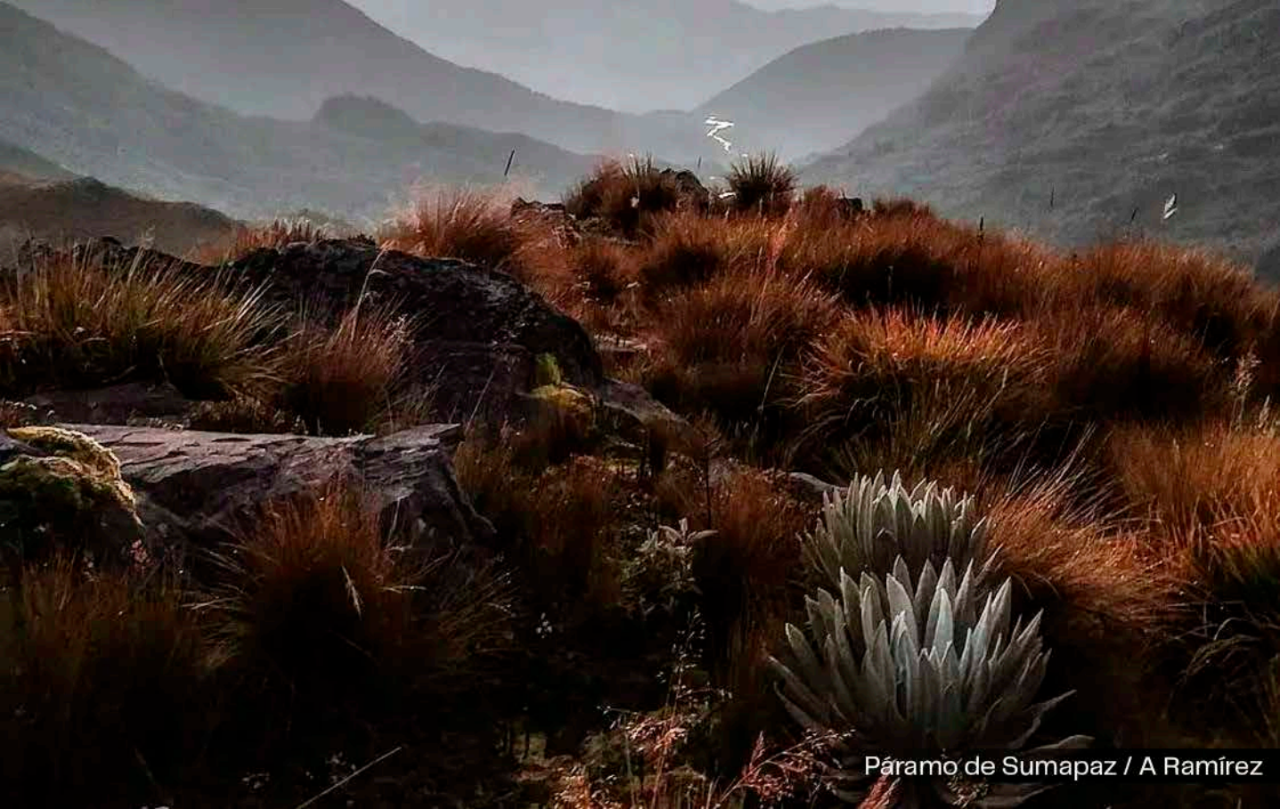
Páramo de Sumapaz / A Ramírez