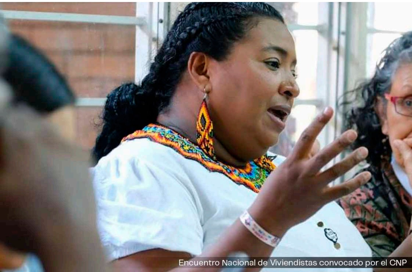
Encuentro Nacional de Viviendistas convocado por el CNP