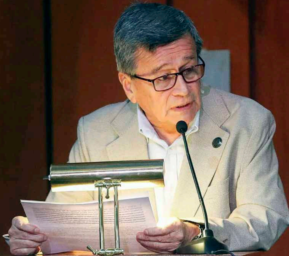
Pablo Beltrán / Jefe de la Delegación de Diálogos del ELN