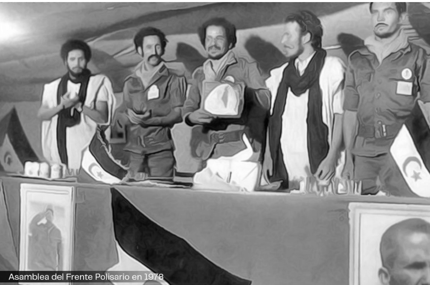
Asamblea del Frente Polisario en 1978