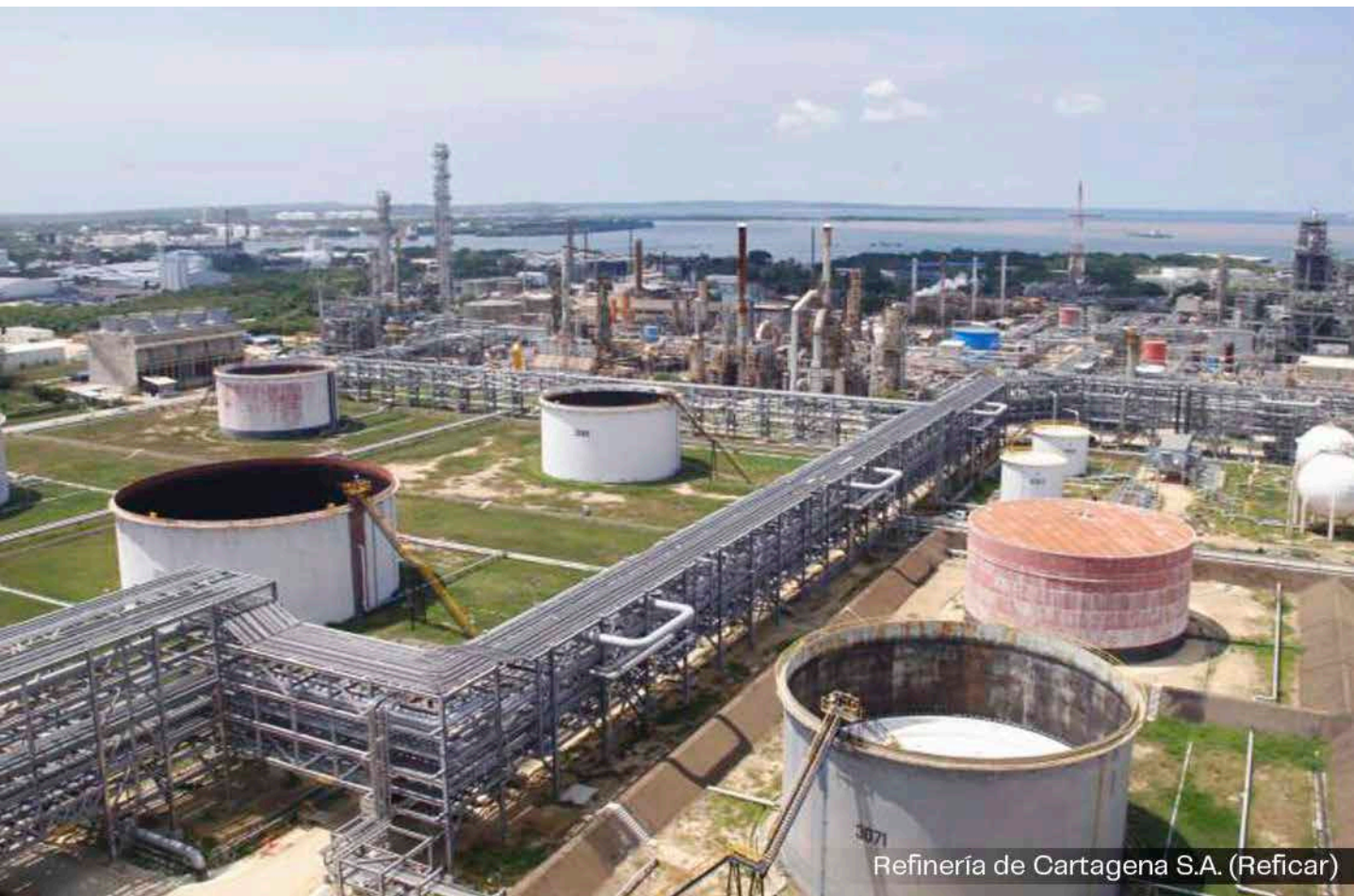
Refinería de Cartagena S.A. (Reficar)