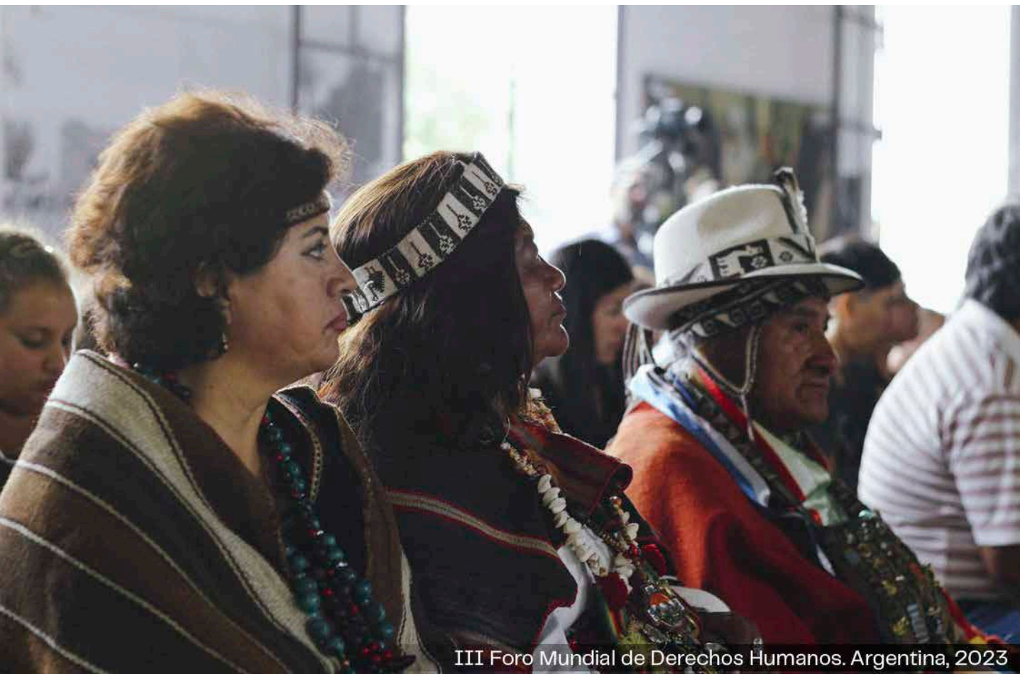
III Foro Mundial de Derechos Humanos. Argentina, 2023