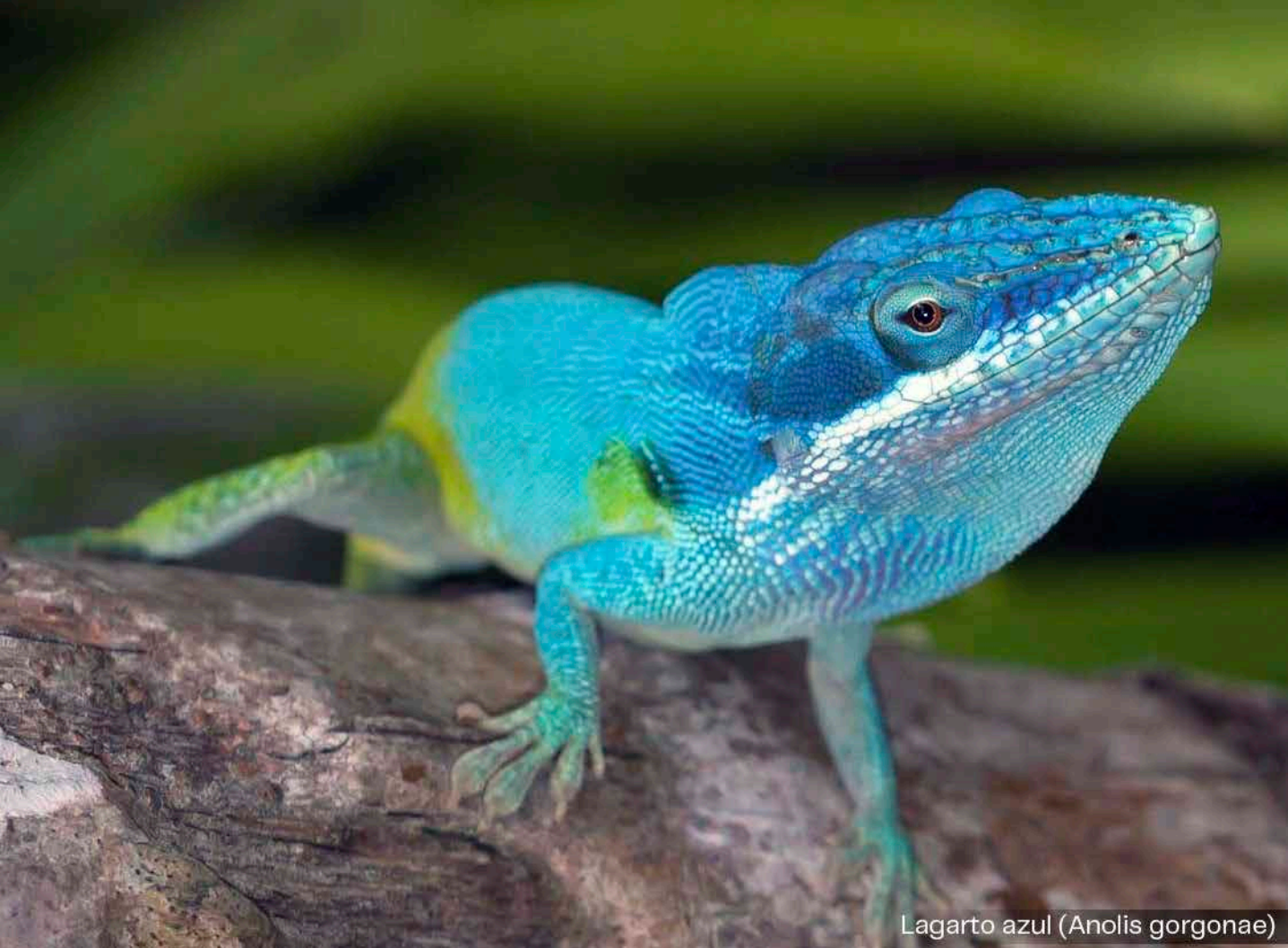
Lagarto azul ( Anolis gorgonae )

supuestamente va tener tubería donde llega gasolina, entonces vamos a tener vertimientos que afectan los corales, Gorgona no tiene nada que ver con el narcotráfico, pero si tiene que ver mucho con la preservación ambiental” [3].