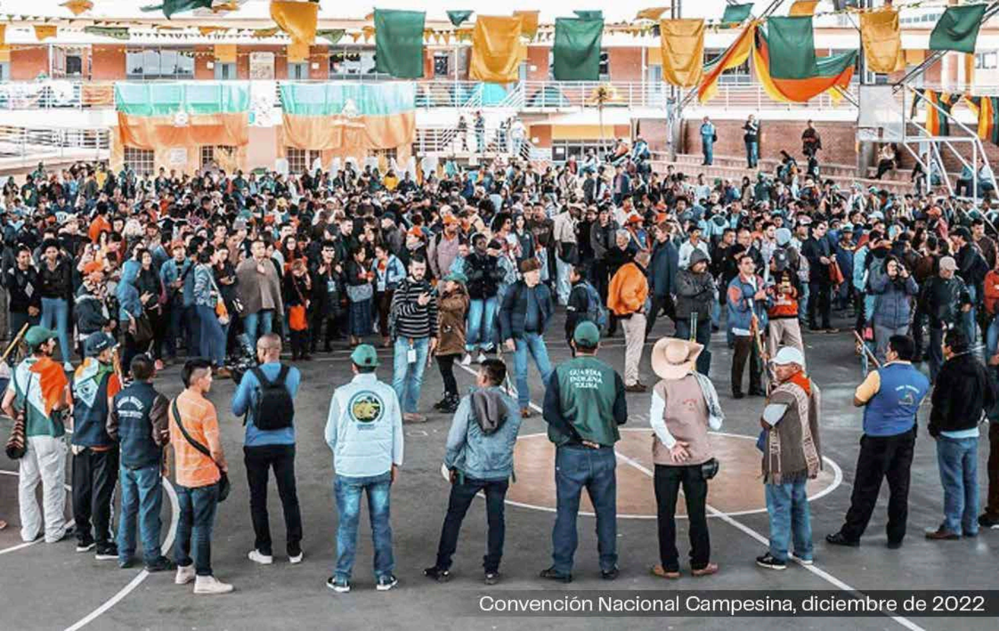
Convención Nacional Campesina, diciembre de 2022

política o la penuria económica, hay que ‘frenar en seco’ que siga creciendo la miseria y la pobreza que agobian a dos tercios de los colombianos, además debemos detener la depredación de nuestra rica y abundante biodiversidad, y resolver la crisis humanitaria que sufren las mayorías nacionales.