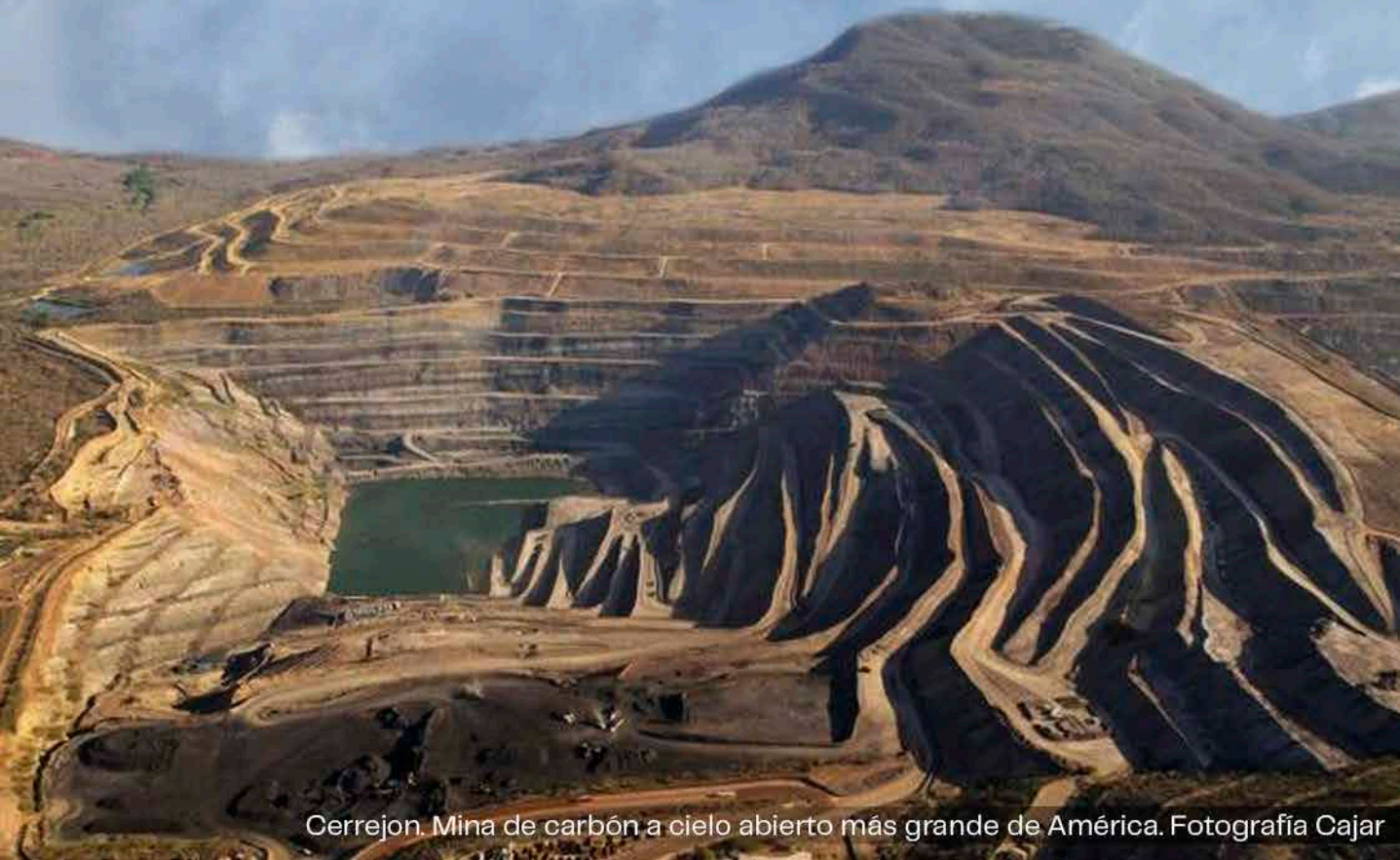
Cerrejon. Mina de carbón a cielo abierto más grande de América.

La sobreindustrialización y la depredación de los bienes naturales han generado una catástrofe humanitaria y ambiental, que incrementa y acelera el Cambio Climático y sus afecciones sobre el medio ambiente, llevándonos a un punto de no retorno que deja el planeta al borde del colapso.