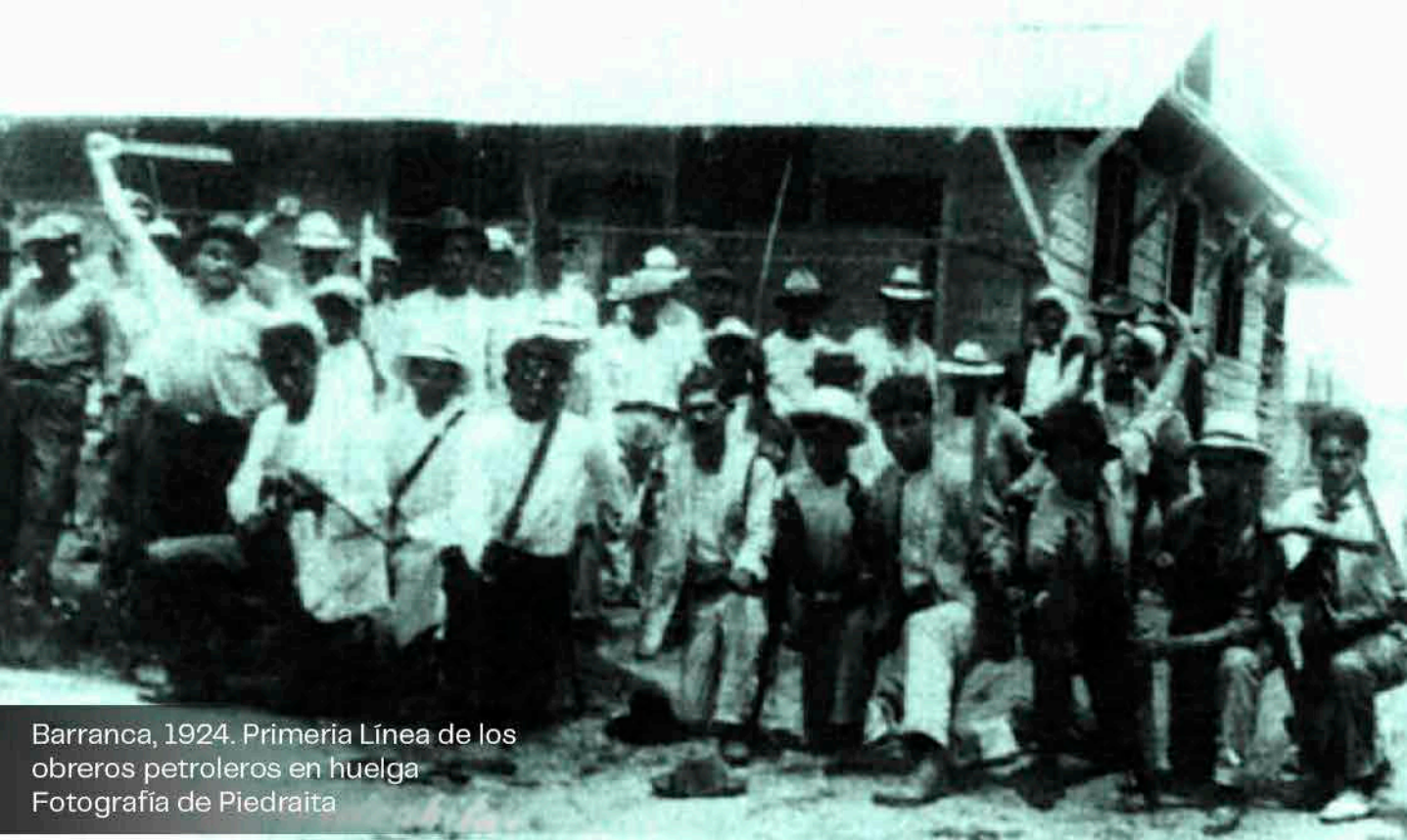
Barranca, 1924. Primería Línea de los obreros petroleros en huelga