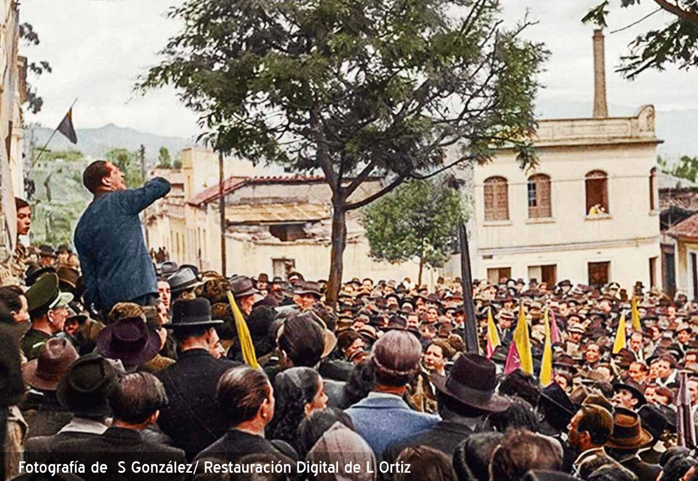
Fotografía de S González/ Restauración Digital de L Ortiz