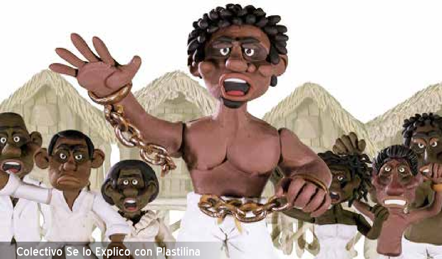
Colectivo Se lo Explico con Plastilina

Líder de la rebelión de negros cimarrones a principios del s. XVII, Al huir de sus esclavistas, fundó el asentamiento libre San Basilio de Palenque, el primer poblado autónomo y libre en América.