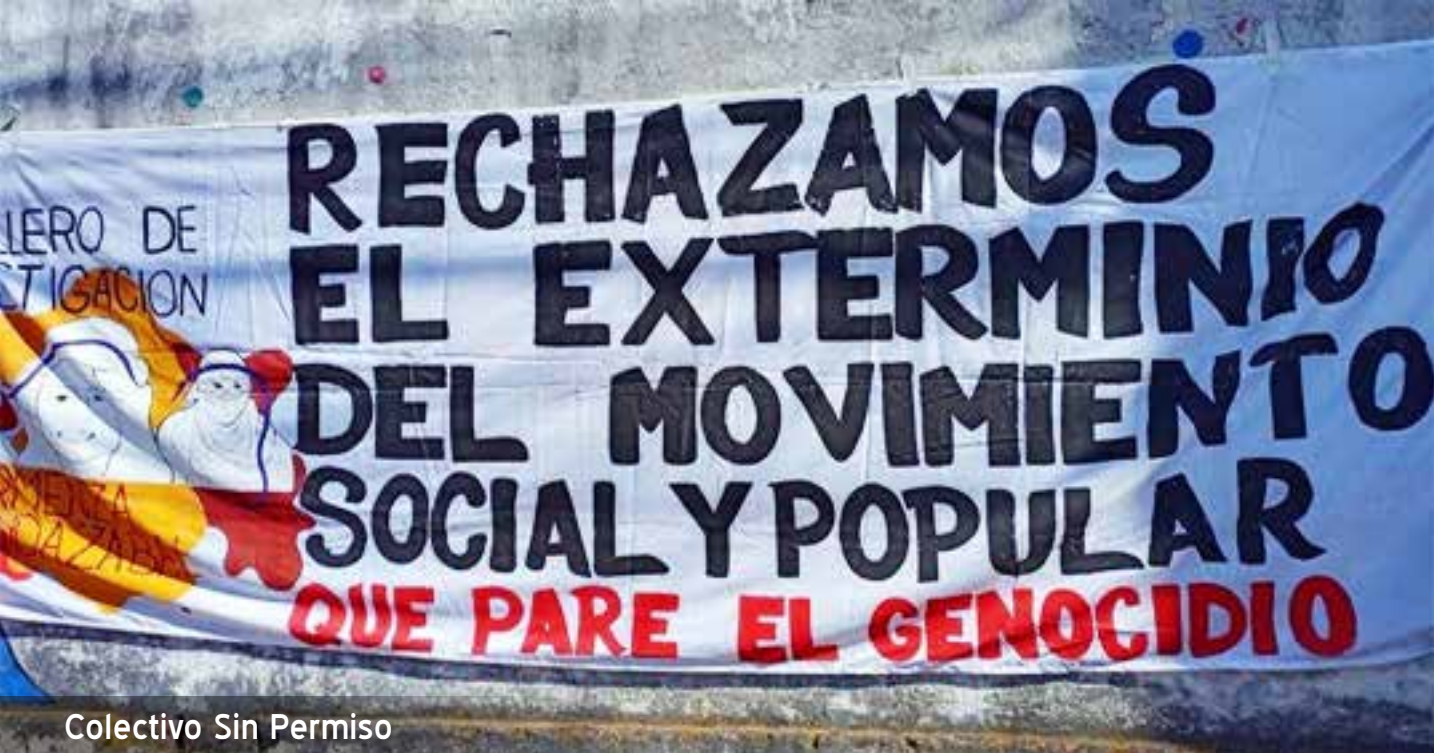
Colectivo Sin Permiso

La ex magistrada auxiliar de la Corte Suprema de Justicia Luz Adriana Camargo afirmó que, “los casos estudiados se presentaron en 30 municipios altamente militarizados, donde hay una fuerte presencia de la Fuerza Pública (...); además, muchas de las víctimas fueron asesinadas en espera de tramitar su situación de riesgo” [5].