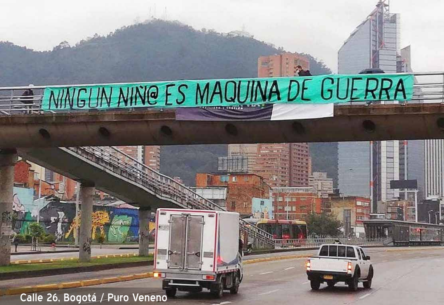
Calle 26, Bogotá / Puro Veneno