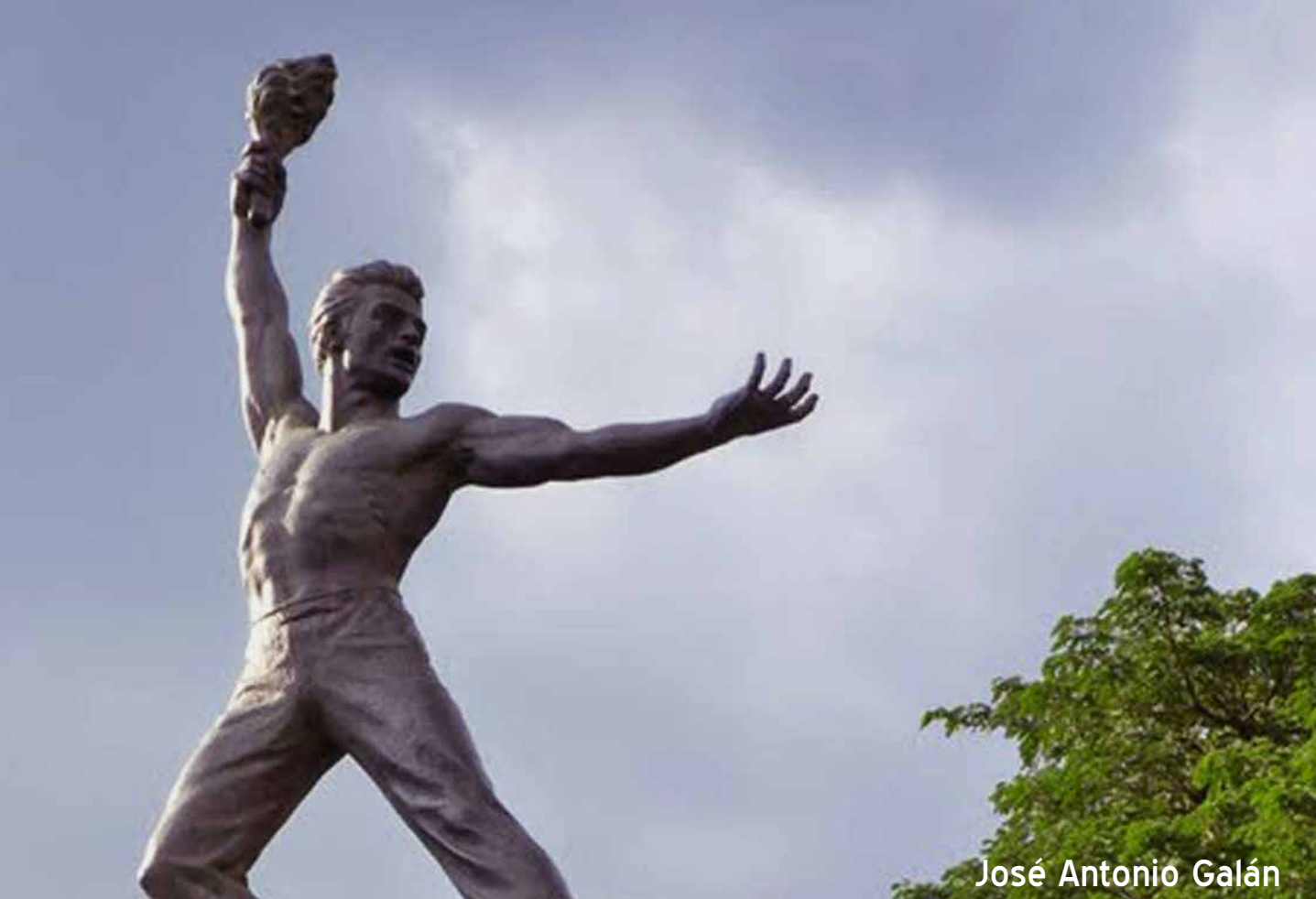
José Antonio Galán